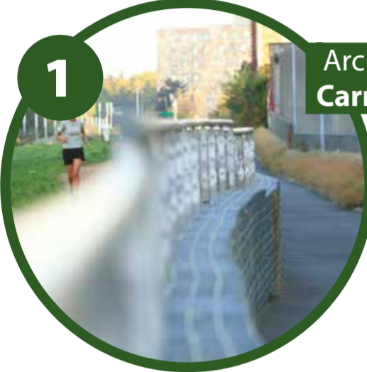
1 Arcueil > 380 m Carrefour de La Vache-noire

Le début de la coulée verte, c'est ici! Une fois la Bièvre ouverte, cette portion comprenant une piste cyclable et un trottoir refait à neuf fera la jonction avec le parc du Coteau. Encadré de verdure quand les lieux le permettent, ce tronçon rappelle aux promeneurs l'ambiance d'une balade à vélo dans la campagne.