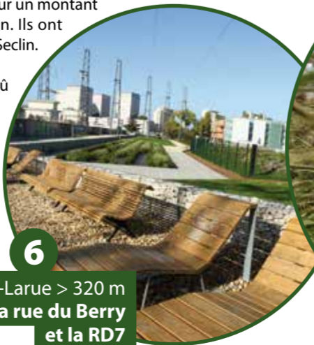
6 Chevilly-Larue > 320 m Entre la rue du Berry et la RD7

En juillet 2013, neuf mois de travaux ont été engagés pour un montant de 1 080 000 € TTC, subventionné à 50 % par la Région. Ils ont permis l'ouverture au public d'un nouveau secteur dit de Seclin. Cet aménagement a représenté un véritable challenge. En effet, polluée, cette ancienne friche industrielle a dû faire l'objet d'une étude sanitaire, puis d'une procédure de confinement des pollutions. Ce travail a permis de réhabiliter un terrain jusqu'alors inexploité, de le revaloriser et de sauvegarder les arbres déjà sur place. Le sol a également dû être remis à niveau sur sa majeure partie. Aujourd'hui s'y trouve un chemin stabilisé, bordé par des murs en gabions (casiers de fils de fer tressés remplis de pierres). Ce paysage minéral a été adouci en conservant de petites allées vertes et une grande prairie qui pourrait, dans le futur, accueillir des jardins familiaux ou partagés.