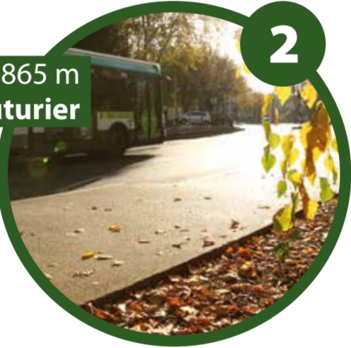
2 Arcueil > 865 m Avenue Paul-Vaillant-Couturier

Le début de la coulée verte, c'est ici! Une fois la Bièvre ouverte, cette portion comprenant une piste cyclable et un trottoir refait à neuf fera la jonction avec le parc du Coteau. Encadré de verdure quand les lieux le permettent, ce tronçon rappelle aux promeneurs l'ambiance d'une balade à vélo dans la campagne.