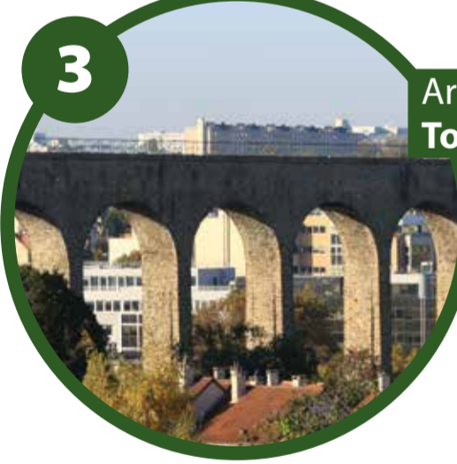
3 Arcueil > 475 m Tour du stade Louis-Frébault

Ce secteur boisé s'étend de la Bièvre jusqu'au carrefour Delaune. Sa circulation est organisée en trois voies pour plus de praticité : la route pour les voitures, une piste cyclable pour les amateurs de vélos et un trottoir élargi pour les piétons. Le tout bénéficie de l'éclairage public afin d'en profiter même les soirs d'été.