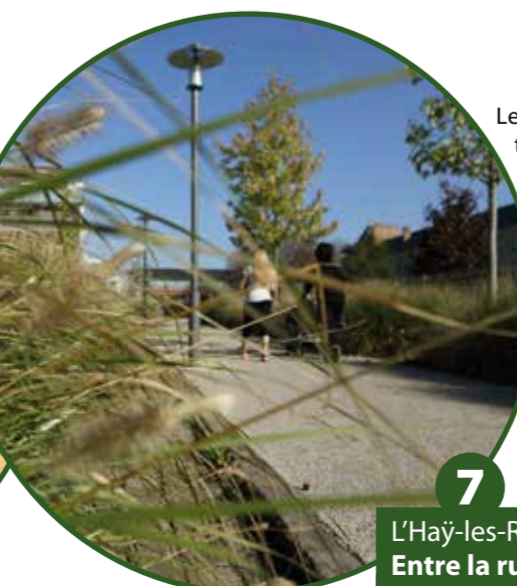
7 L'Hay-les-Roses > 800 m Entre la rue Sainte-Colombe et la rue Paul-Hochard

Le mois de septembre 2014 a vu se terminer les travaux de la coulée verte reliant la rue Sainte-Colombe à la rue Paul-Hochard. D'une durée de quatre mois, ces aménagements ont permis d'améliorer les pieds des immeubles de ce secteur, où la coulée verte serpente désormais. À la place des anciennes allées, devant les résidences se trouve désormais un chemin tout en courbes, réservant une plus grande place aux pelouses sur lesquelles les platanes déjà présents ont été conservés. L'opération a coûté 280 000 € TTC dont 50 % subventionnés par la Région.