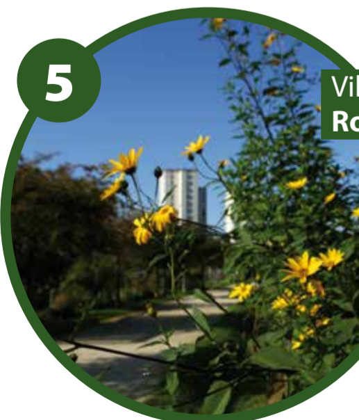
5 Villejuif > 1 km Roses rouges

Ce tronçon, situé entre la rue Camille Desmoulins et la rue du Docteur-Pinel, a fait l'objet d'un aménagement provisoire avec une piste cyclable et un trottoir élargi pour favoriser les circulations douces, en attendant les futurs travaux sur le quartier.