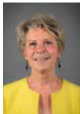
Vice-présidente chargée de la Prévention et de la protection de l'enfance et de l'adolescence, et de la coopération internationale