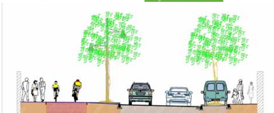
Vue en coupe du futur partage de la voirie, au niveau du quai Brossolette.