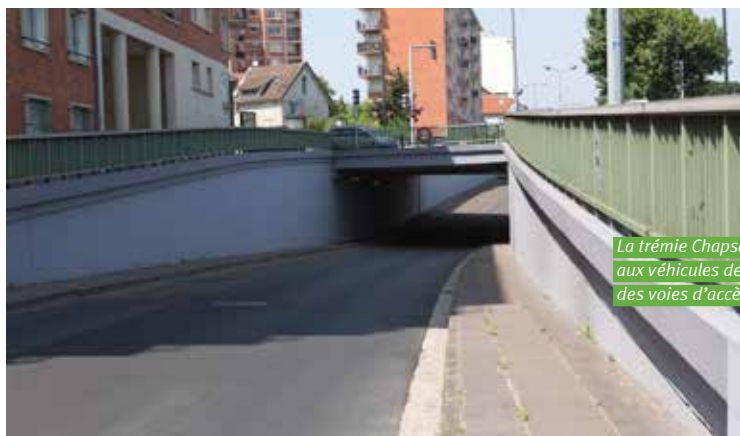
La trémie Chapsal est le tunnel qui permet aux véhicules de circuler au-dessous des voies d'accès au pont de Joinville.