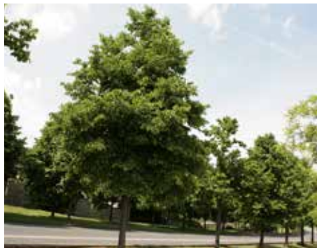
Des noisetiers de Byzance ( corylus colurna ) seront plantés le long de la rue Chapsal et formeront, à terme, un alignement similaire à celui-ci.

→ Le cadre de vie des riverains gagnera en sécurité et en sérénité.