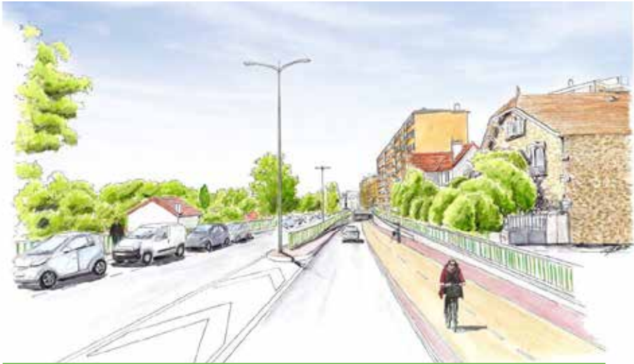
La rue Chapsal, vue depuis le nord : une seule file de circulation sous la trémie pour faire place à la piste cyclable bi-directionnelle